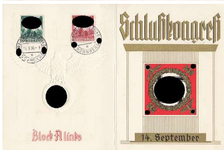
525 Reichsparteitag 1936 „Schluß- kongress“, gelaufen Limit: € 30,00